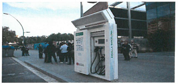
스마트거리 전기 충전기