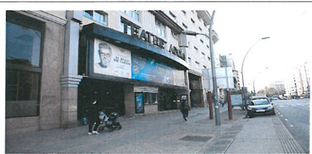
바르셀로나 22@ 혁신지구 인간 중심 거리