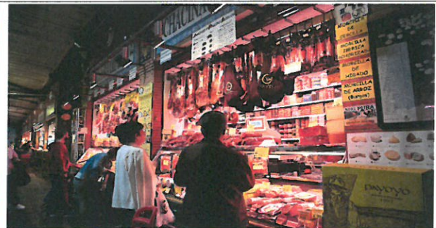
트리아나 시장 특산품 조사