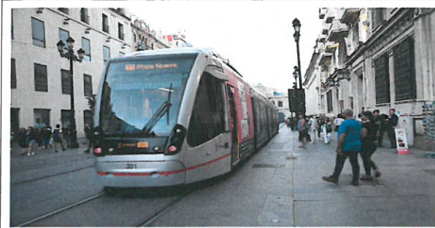
스마트 거리 지하철