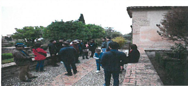
알람브라 나자렛 궁전