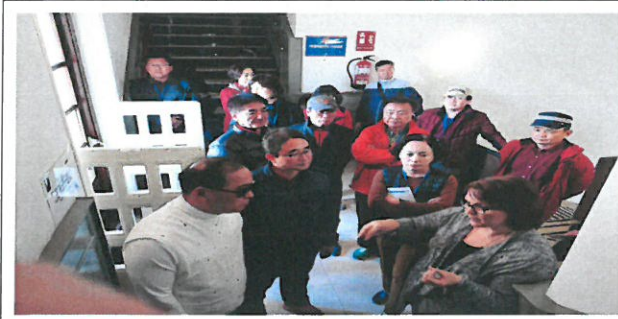
Biblioteca de Castilla-La Mancha 공립 도서관 브리핑