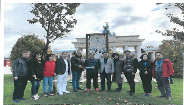
TORRON 파르케 유로파 공원 단체사진