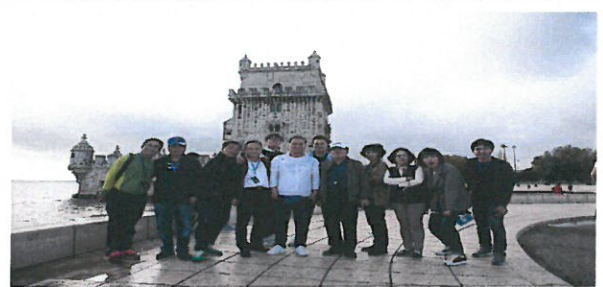
스페인 무역항 단체 사진