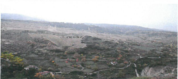
올리브 오일 나무