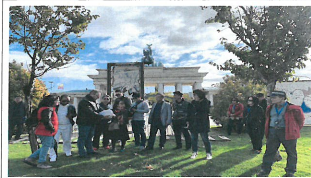
TORRON 파르케 유로파 공원 브리핑