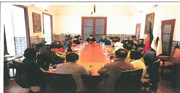
SANTA CASA 복지재단 기관 방문 및 질의·응답