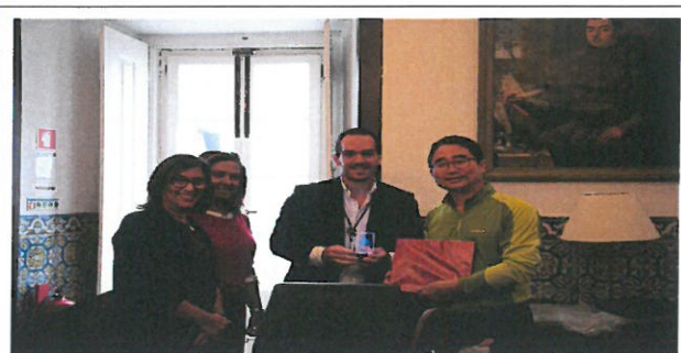
SANTA CASA 복지재단 기념품 전달