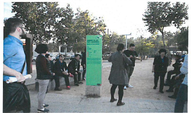
바르셀로나 스마트 거리 질의·응답