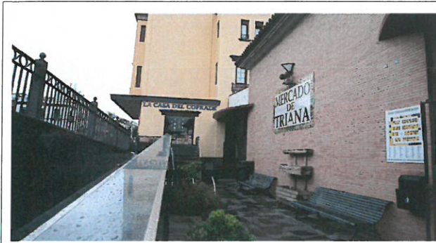
트리아나 재래시장 외부