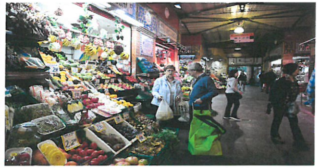
트리아나 시장 내부