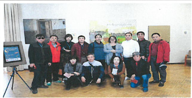
Biblioteca de Castilla-La Mancha 공립 도서관 단체사진